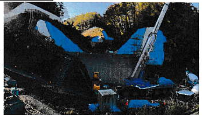
写真①-2 沈砂調整池堰堤 コンクリート打設状況