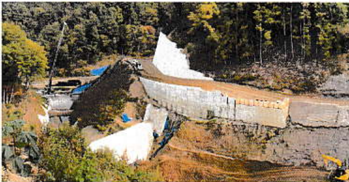
写真③ 搬入道路 擁壁構築状況