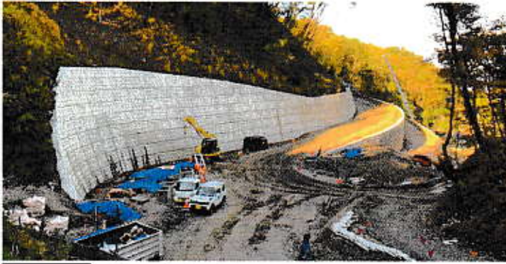
写真② 搬入道路 擁壁構築状況